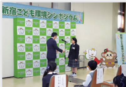
「新宿こども環境シンポジウム2023」 (表彰式)の様子

令和5(2023)年度は、計163点ものご応募を頂き、審査会を経て28点が受賞しました。